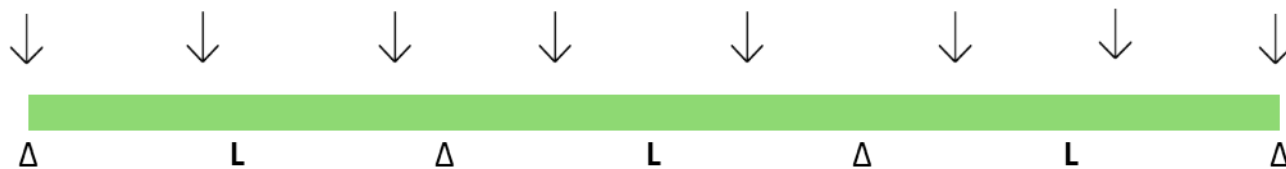
TABELLA DI PORTATA PER CAMPATE MULTIPLE